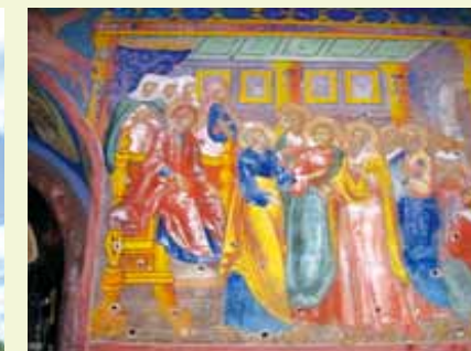
▲ Intérieur d'église à Kiev.