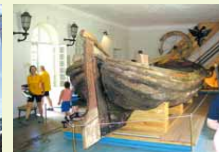
▲ Le bateau de Pierre le Grand.