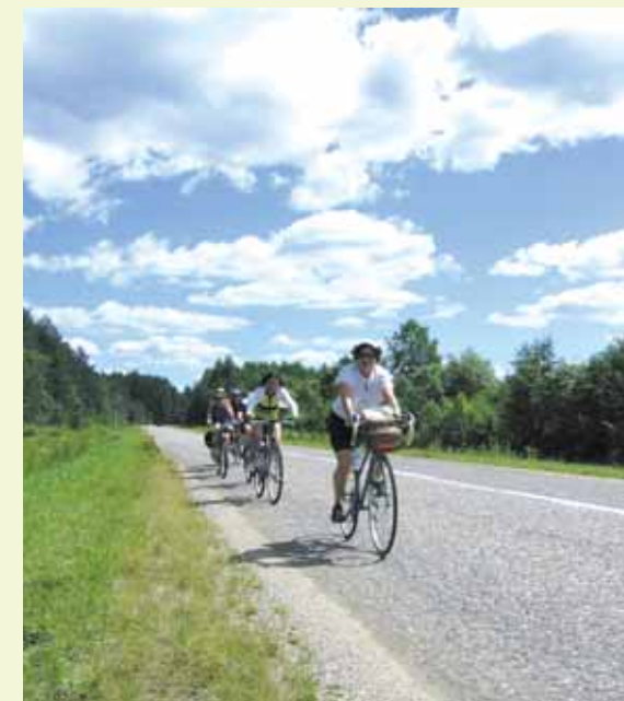
Sur la route. ▲