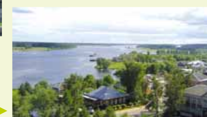
La Volga à Michkine. ►