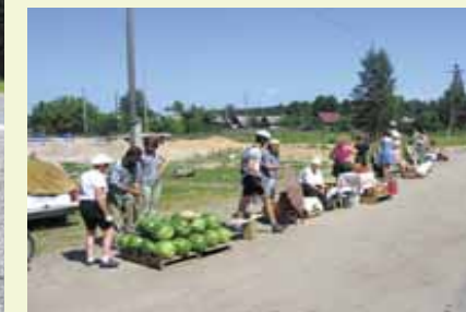
▲ Marchands aux bords des routes.